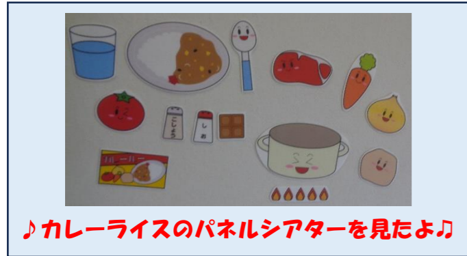
♪カレーライスのパネルシアターを見たよ♪

楽しみにしていたカレークッキング！丁寧に手洗い・消毒をしてはじめました。慎重に野菜を切って、給食先生に作り方を見せてもらって大満足の子どもたちでした！