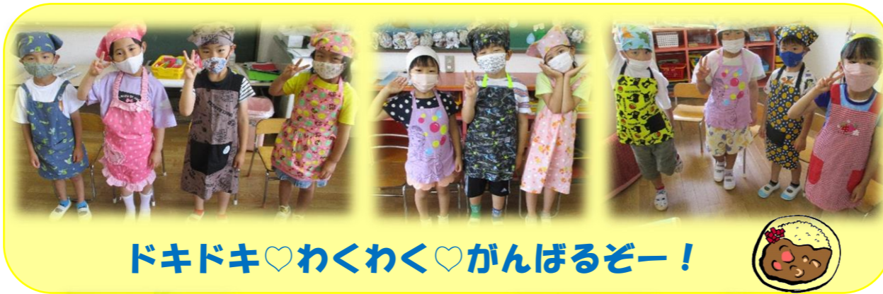
ドキドキ♡わくわく♡がんばるぞー！