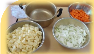
切った野菜とカレーのルーを作る調味料！