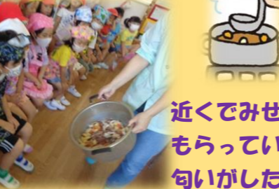
近くでみせてもらっていい匂いがしたね