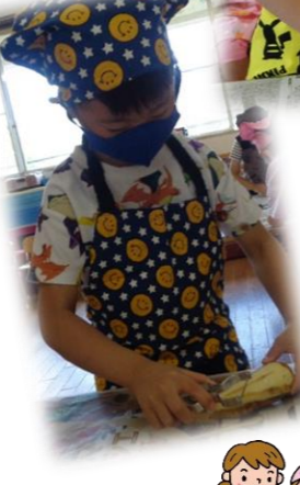
人参とじゃが芋の皮をむいて...